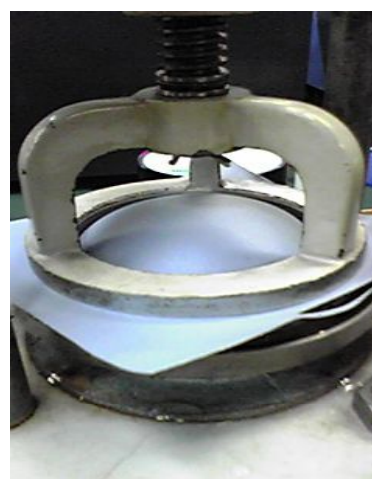
防水試験(JIS K 6404 ) 0.3MPa(水圧)×1分間で漏れ無し