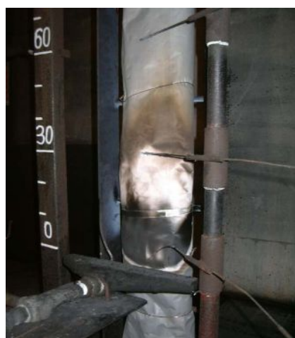
垂直トレイ燃焼試験(JIS C 3521) 800℃×20分間燃焼後、通気遮断層の 破れ無し